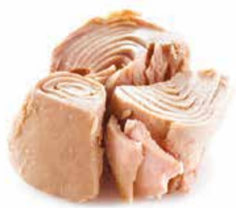
Atum Tunny fish | Thon