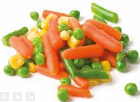
Macedónia Mix vegetables Macédoine