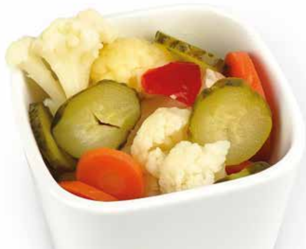
Picles Pickles | Pickles