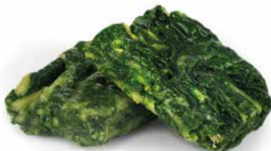
Grelos Turnip greens | Fanes de navet