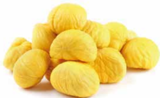
Castanha crúa Raw chestnut | Châtaigne crue