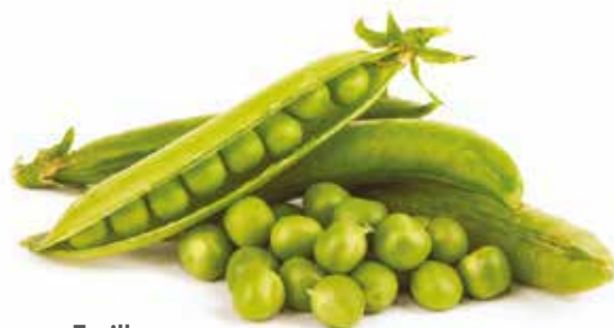
Ervilhas Green peas | Petit pois