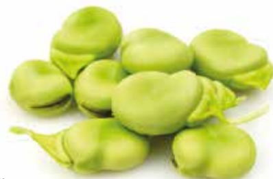
Favas Broad beans | Fèves