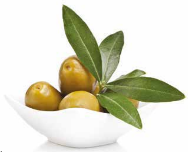
Azeitonas Olives | Olives