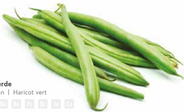
Feijão verde Green bean | Haricot vert