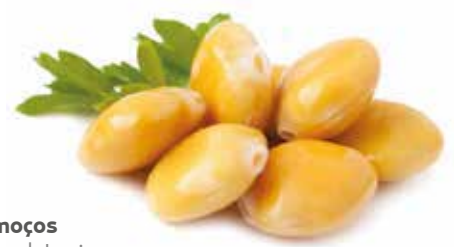
Tremoços Lupine | Lupins