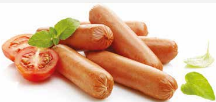
Salsichas Sausages | Saucisses